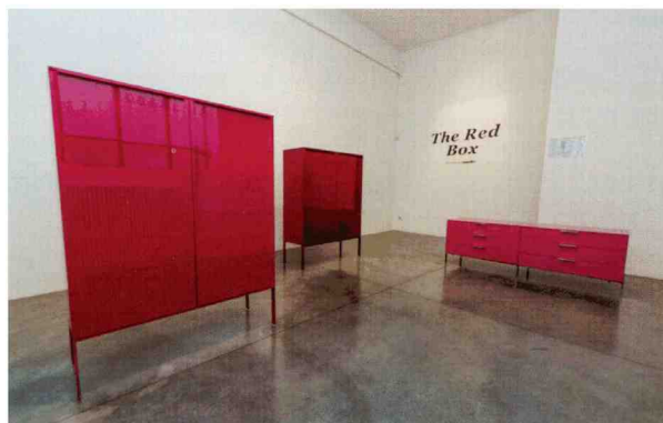
An Emotional Journey into Color di Iva Vernici per Legno An Emotional Journey into Color by Iva Vernici per Legno

Iva Vernici per Legno , in collaborazione con l'architetto Giulio Cappellini, ha presentato 'An Emotional Journey into Color' un'installazione suddivisa in tre aree distinte: The Green Landscape, uno scultoreo paesaggio di una città ideale, in un susseguirsi di pannelli in legno dalle forme e misure più diverse e colorati nelle più svariate tonalità di verde: dal verde brillante al verde bottiglia, dal verde prato al verde scuro; proposti anche in differenti effetti; The Color Lab, uno spaccato del laboratorio dove vengono ideate e prodotte le vernici: in bella mostra, alambicchi, provette, centrifughe, filtri, distillatori usati per produrre vernici: effetto legno, effetto ottone, effetto madreperla, vernici profumate... Infinite le possibilità, infinite le personalizzazioni, infinita la capacità del laboratorio di produrre proprio la vernice su misura, capace di rispondere a qualsiasi esigenza di design; The Red Box: un corner con mobili laccati in lucidissime tonalità di rosso.